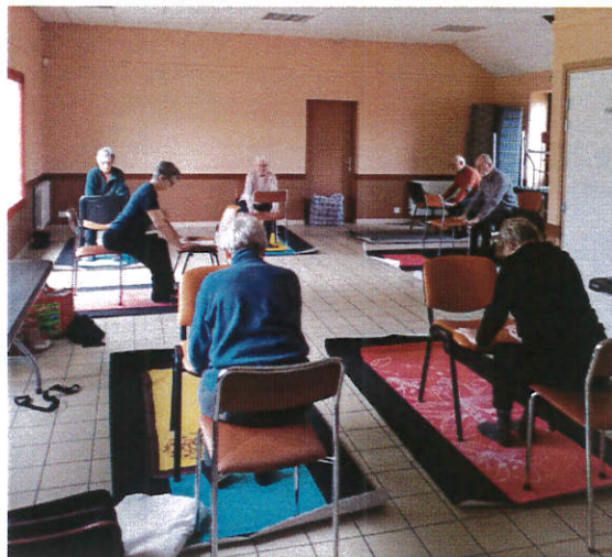
Séance de Yoga

Dans le cadre du bien-être et du maintien de la forme, les Feugeoises ont fêté Noël 2023 lors d'une séance d'AQUAGYM à la piscine NAGEO.