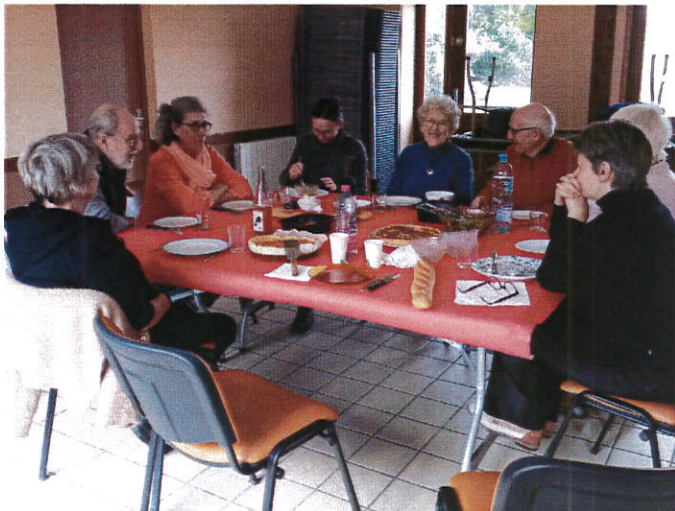
Un repas convivial

Le YOG'A Feuges remercie la commune pour le prêt de la salle polyvalente pour ces activités.