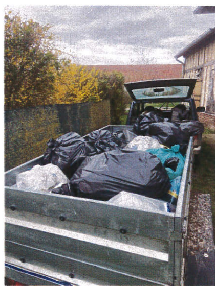
Trois remorques de détritrus ont été remplies