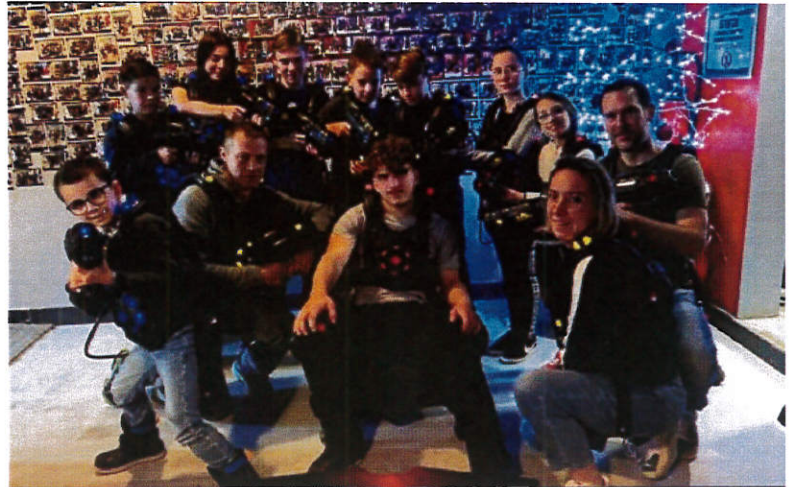
Sortie Laser Game

Les anciens qui n'avaient pas participé au repas annuel se sont quant à eux vu remettre un colis à leur domicile le samedi 16 décembre au matin.