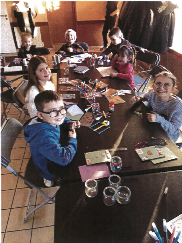
Les activités créatives