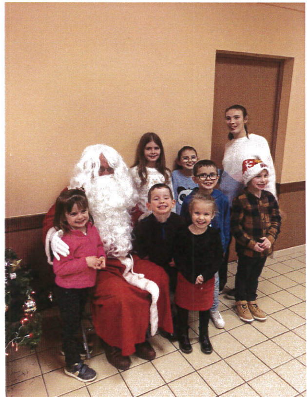
Visite du Père Noël